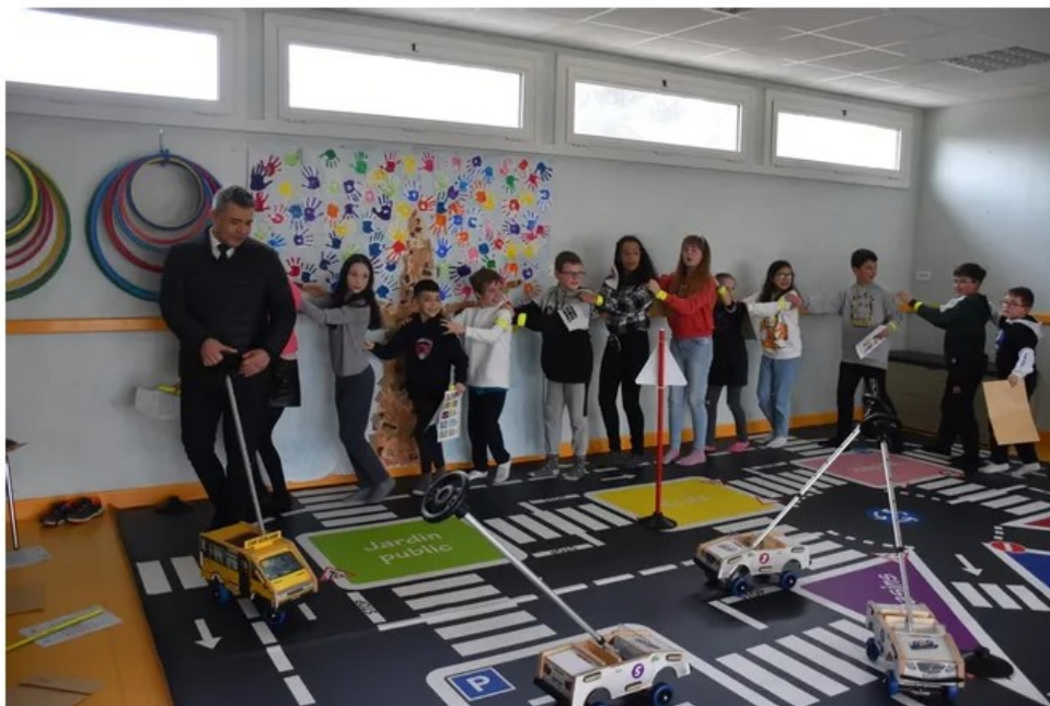
Conduite sur la piste Buggy Brousse pour adopter les bons réflexes.